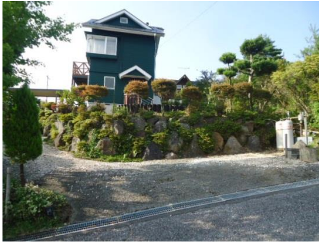
駐車場(玄関へのアプローチにも駐車できます)