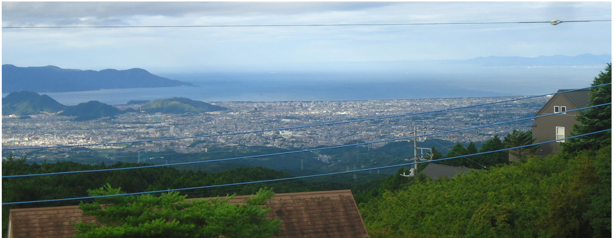
2階ウッドデッキからの駿河湾の眺望。眼下に三島・沼津の街並みが広がり、きれいな夕日や夜景も眺められます。