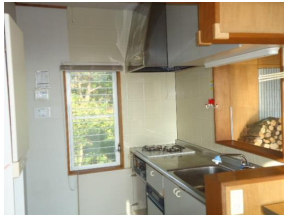
2階キッチン(手前にはカウンター)