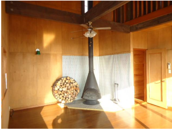
2階19畳のリビングと薪ストーブ