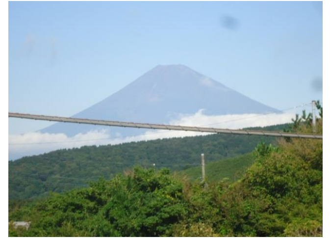
2階ウッドデッキからの富士山