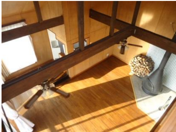
吹抜けの開放感あるリビング