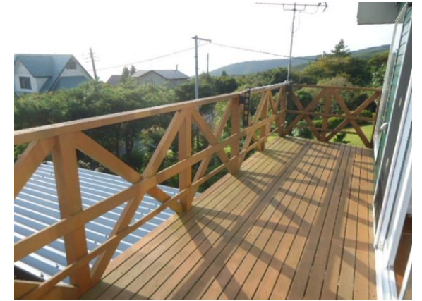
2階の広々したウッドデッキ