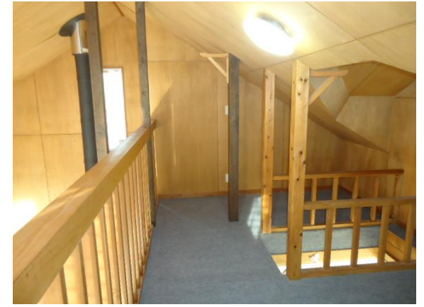
2階和室上のロフト