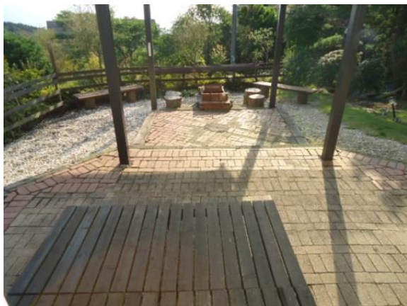
1階デッキテラスと煉瓦敷きのお庭