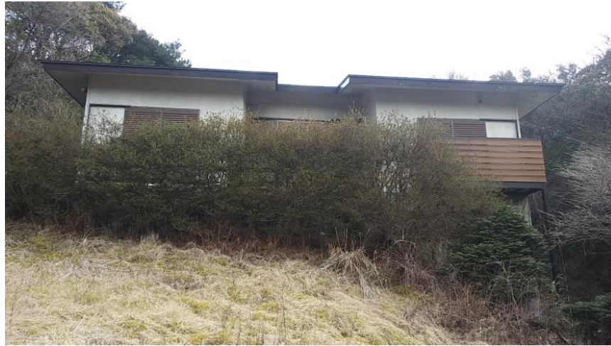
北側から建物の正面を臨む。向って右が洋室、左が和室。