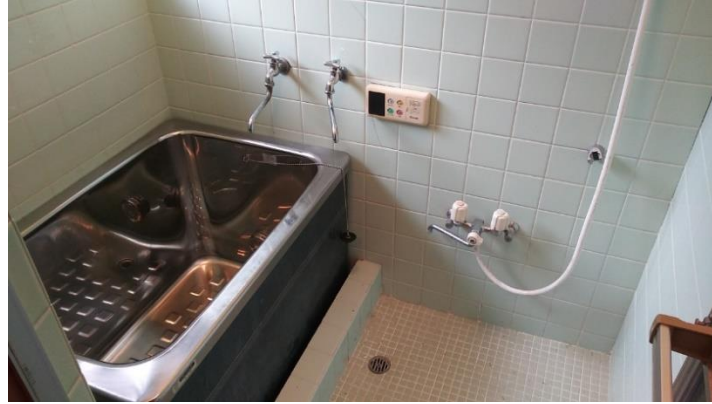
タイル貼りの浴室