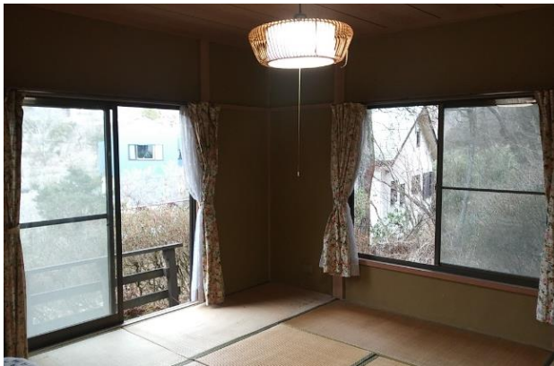
2面窓で明るく風通しの良い和室