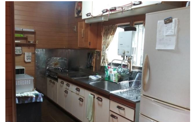
8帖の広さのリビングダイニングの奥にキッチンと和室があります。ゆったり幅 2m60cm の流し台・ガスレンジのあるキッチンは、窓から明るい日が入ります。