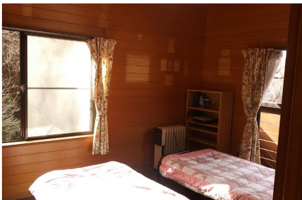
洋室の室内壁も板張りです。ベランダからは木々の緑と山の端からは富士山の頭が覗きます。