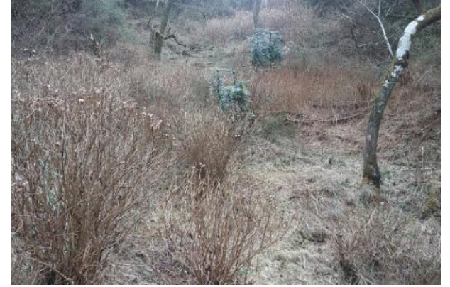
建物の南側にも敷地があります。